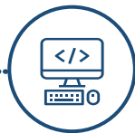
Programmation Et simulation