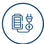
Électronique de puissance

« Un système pédagogique unique pour une multitude de travaux pratiques »