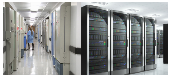
Solutions de secours pour palier les coupures électriques