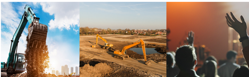
Sites hors réseau électrique